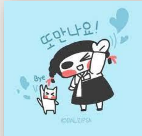
폴이 친구를 만나요