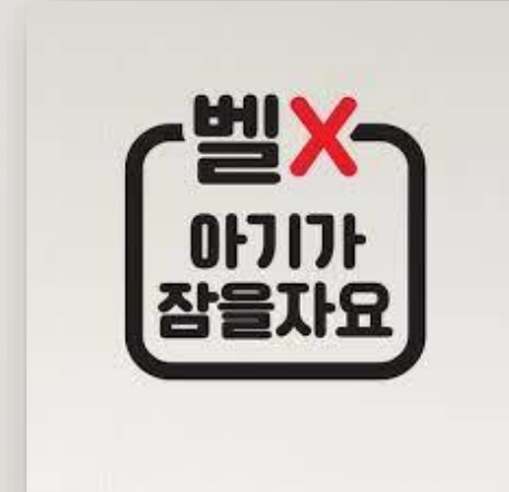
아기가 잠을 자요